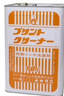
11. プリントクリーナー