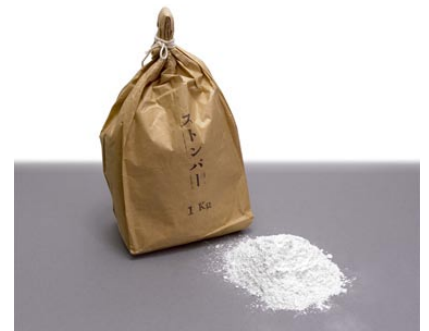
12. タルク（ストーンパウダー）