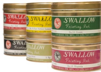
21. プリントインク (リトグラフ用)