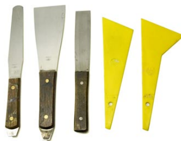
23. インクベラ (スパチュール)