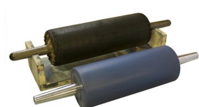
24. 革ローラー・ゴムローラー