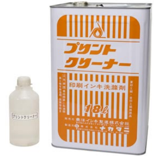
10. プリントクリーナー