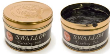
20. 製版インク (リトグラフ用)