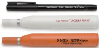
16. カキロン・ケシロン