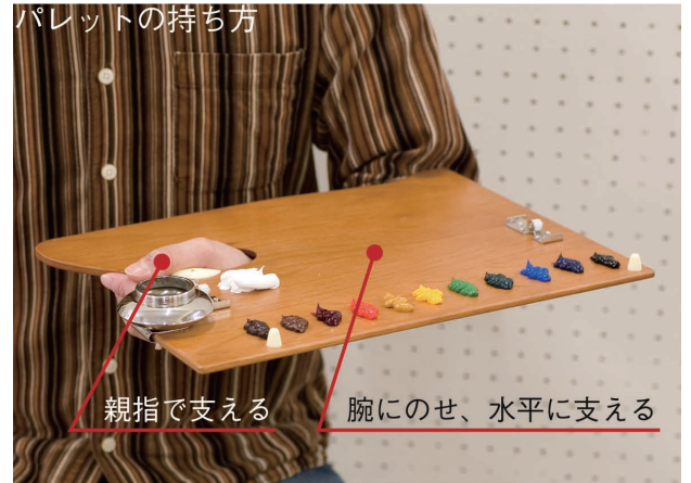
パレットの持ち方