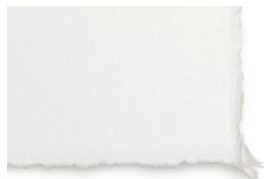
12. 裏打ち用台紙 (BFK リーブなどの版画用紙)