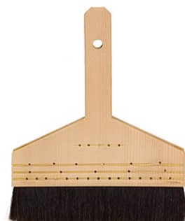
13. 打ち刷毛（木口木版の裏打ち用）