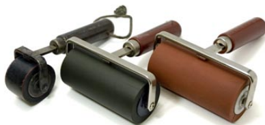
5. ローラー（ハンドローラー）