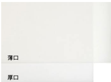
19. トレーシングペーパー