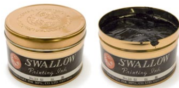
3. 製版インク（リトグラフ用）