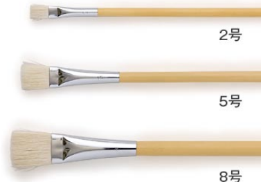
9. 平筆 (日本画用)