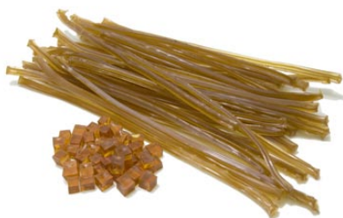
3. 膠 (三千本膠・鹿膠)