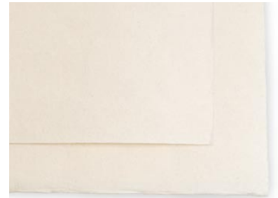
24. 和紙 (雲肌麻紙など)