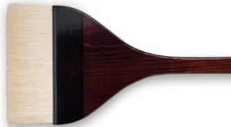
絵刷毛 4寸 (約12cm)