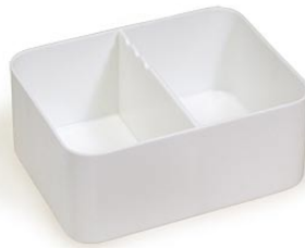
17. 筆洗 (日本画・水彩画用)