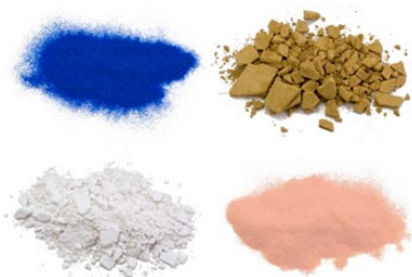
1. 日本画絵具 (岩絵具・水干絵具・胡粉など)