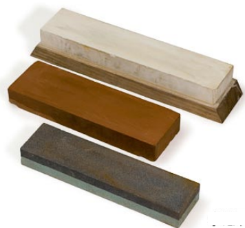
4. 砥石 5. 浅丸ノミ・極浅丸ノミ (さらい用の各種ノミ)