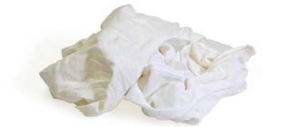
18. ウェス (メリヤス地のもの)