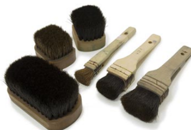
10. 版画用ブラシ（摺り刷毛）