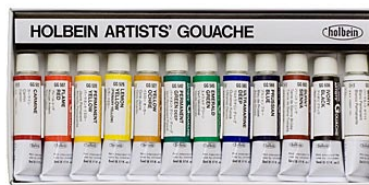
7. 水彩絵具（透明水彩・不透明水彩）