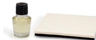
14. 椿油・バレンパッド