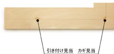
引き付け見当 カギ見当