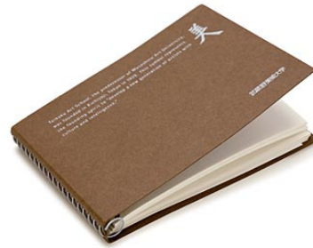
5. クロッキーブック